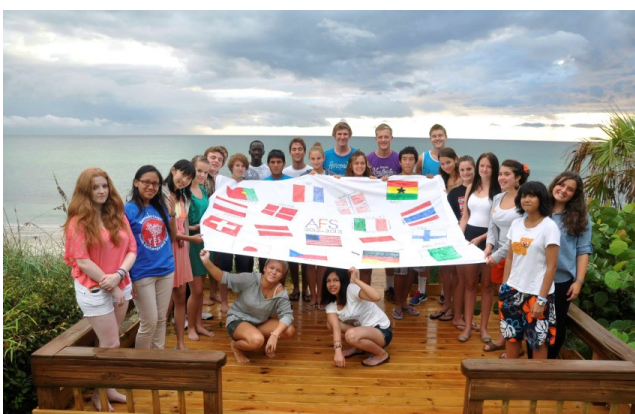
En af de første weekend orienteringer vi havde med AFS

Efter at have været i USA i omkring 6 måneder, har jeg nu en del indsigt i amerikansk kultur, men også i kulturer fra andre lande. Det, som er så fantastisk ved AFS, er at det bringer kulturer fra hele verden sammen på en måde jeg ikke havde kunnet forestille mig. I år i Florida er der AFS udvekslingsstuderende fra Norge, Tyskland, Finland, Østrig, Schweiz, Italien, Frankrig, Portugal, Tjekkioslovakiet, Thailand, Japan, Ghana, Sri Lanka, Indonesien og Afghanistan. AFS'ere fra 15 lande har jeg fået knyttet venskaber til. Vi mødes et par gange om måneden til orienteringer med de respektive AFS regionsledere og fremlægger præsentationer om vores hjemlande.