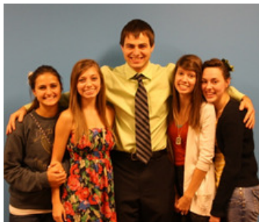
Mine søskende og jeg (brun bluse)

Jeg har taget muligheden til at komme til USA i et helt år for at opleve den Amerikanske kultur, lære sproget så jeg kan tage engelsk A i gymnasiet i Danmark, og for at lære at håndtere situationer ved at se på sagen fra flere sider.