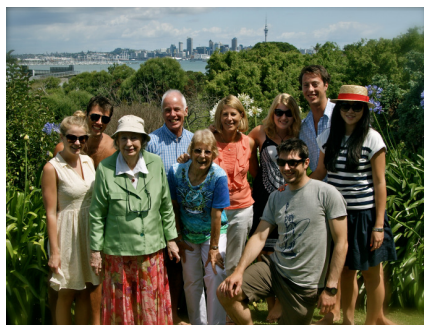
Mig og min familie juledag (jeg er pigen med solbriller på og blond hår i anden række)

Siden hen har jeg skiftet familie. Min værtsmor har nyresvigt og det vidste jeg godt allerede da jeg kom, så i løbet af de 6 måneder jeg boede der var det blevet værre og vi indså at det var bedst at skifte familie for både min skyld og min families. Så jeg flyttede ind ved min support koordinator og boede der en måneds tid før jeg fik en ny familie. Da jeg endelig flyttede til min nye familie var jeg meget taknemmelig for alt hvad de gjorde for mig. Fordi jeg ikke havde