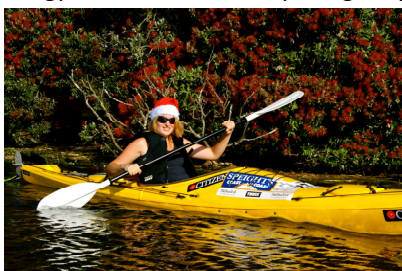
Jeg ror i kajak juledag

I begyndelsen da alt var nyt sørgede jeg for at tage mig god tid til at tilpasse mig til de nye omgivelser.