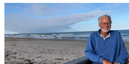
2018 The Same guy now 78 years old