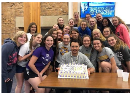
Mit fodboldhold og træner fejrer hans kamp 100 vundet som træner

Mit år i Ashland, Wisconsin i USA var fyldt med fantastiske oplevelser og minder som f.eks. homecoming, thanksgiving, halloween og prom, men min yndlingsoplevelse fra hele turen var da min værtsfamilie og jeg tog til Colorado på juleferie. Min værtsfamilie kommer fra Colorado og holder derfor jul i Colorado hvert år, så selvfølgelig var julen 2018 ingen undtagelse. Jeg havde glædet mig i flere uger til at vi skulle afsted. Jeg havde aldrig været i Colorado før, men min værtsfamilie havde fortalt mig en hel masse ting om det, så jeg glædede mig meget til at se det med mine egne øjne. Jeg var dog også meget nervøs for turen. Jeg skulle møde resten af min værtsfamilie familie, og