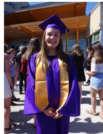
Mig til graduation

Selvom mit år i USA var fantastisk, var det som sagt også fyldt med både op og nedture. Når man vælger at tage et år til et andet land, vælger man samtidig også at rejse væk fra alt hvad man kender derhjemme, og at forlade ens trygge rammer. Man vender i princippet op og ned på ens hverdag, og det kan være rigtig svært at håndtere lige i starten. Man kan få hjemve, føle sig alene og spekulere over, om det overhoved var det rigtige man havde gjort. Når det så er sagt, møder man også en masse nye mennesker, får en masse fantastiske minder og får en oplevelse for livet, så for mig var det det hele værd. Jeg elskede hvert et minut af min tur til USA, selvom det nogle gange var hårdt, og jeg kan helt klart anbefale det til alle der overvejer, at tage på udveksling i et andet land.