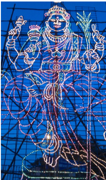
På religiøse festivaler er der altid et lysbillede af en hindu gud.

Ja, fattigdom spiller også en rolle. Gadehygiejnen er ikke den bedste med skrald på gaderne og slum omkring floden der løber gennem byen. Køer, grise, geder og høns er også til at finde.