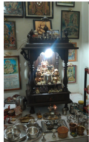
Et pooja -alter. Det er et i hvert hjem, og det er der hinduerne udfører ofringer til deres guder.