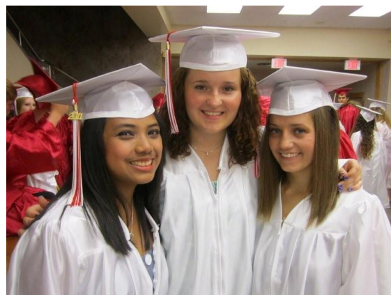
Graduation – flankeret af mine AFS-veninder fra Thailand og Norge

Jeg havde en masse ideer og tanker, om hvordan mit år her i USA ville være, og det har vist sig at være meget anderledes. De har ikke så god offentlig transport, når man bor i en lille by, som jeg gør. Hvilket gør det svært at komme rundt omkring. Det gør dog ikke så meget, da jeg bruger det meste af min tid på skolen.