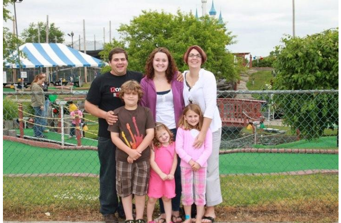
Sidste familiefoto inden afrejsen

Det her har helt sikkert været en kæmpe oplevelse og bliver den ved med at være, de sidste 5 måneder jeg har tilbage. Det har dog ikke været let hele tiden, og savnet til venner og familie er stort, men jeg ville ikke have undværet min tid i USA, det har gjort mig rig på en masse oplevelser og nye bekendtskaber, og det er noget, som jeg altid vil huske.