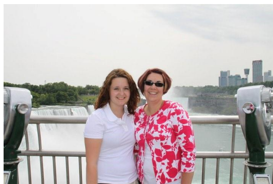
Min dejlige værtsmor og mig

Men en anden ting, som er meget anderledes end i Danmark er deres skolesystem, og alle de forskellige aktiviteter, som skolerne herovre tilbyder. Sport er noget de tager meget seriøst og går meget op i. Jeg deltog på skolens volleyball hold i efteråret, og det var en sjov