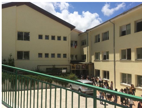
Den store gule bygning er den skole jeg gik i, i Italien. Skolen varede kun fra 8.30 til 13.00, men jeg gik også i skole om lørdagen

Når jeg tænker tilbage nu, 2 år efter min hjemkomst, er det der fylder mest, alle de ting jeg lærte og blev klogere på, mens jeg var afsted. Først og fremmest begyndte jeg at se Danmark i et andet perspektiv. Selvom det var Italien, jeg var taget til, lærte jeg faktisk vildt meget om mig selv og om Danmark. Da jeg kom til Italien, så jeg, at man sagtens kan gøre tingene på en anderledes måde, end den man er vant til. I det område jeg boede i, i Italien, går man for det meste ture i byen, når man er sammen med sine venner. I Danmark er jeg mere vant til at sidde på mine venners værelse og hygge. I Italien var der også større afstande - for eksempel til skolen. I Danmark er jeg vant til altid at kunne tage min cykel og ikke være afhængig af en bus. Jeg begyndte at tænke mere over de ting ved min kultur,