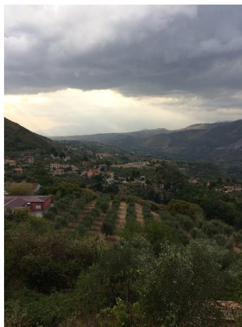
Jeg boede i en lille landsby på toppen af et bjerg i Syd-Italien. Billedet tog jeg af udsigten, dagen efter jeg ankom til min værtsfamilie.

interessert i andre lande og kulturer. I Italien var der nogle regionale orienteringslejre, hvor alle udvekslingsstudenter i Italien mødtes i nogle dage for blandt andet at udveksle historier og tanker.