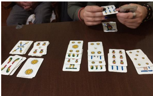
Min værtsøster lærte mig at spille med napolitanske spillekort, og jeg købte et sæt med hjem til mig selv.

Man lærer vildt mange ting, når man er på udveksling. Jeg