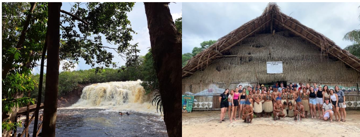
Billeder fra Amazonas

frøer og de smukkeste udsyn til den rolige, uendeligt magiske regnskov. Jeg ved, at der i mit hjerte, for altid, vil være reserveret en lille, speciel plads for mit unikke Amazonas.